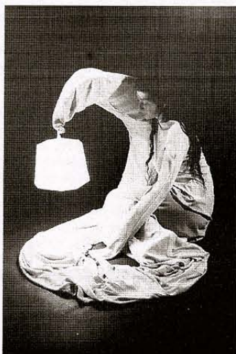
Segundo accésit. «Luciernaga II», de Naia del Castillo