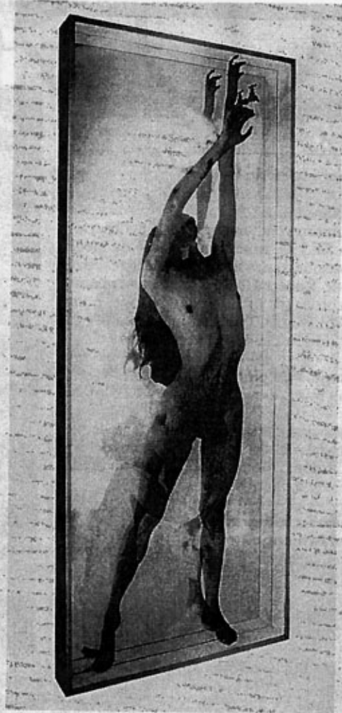
"Sed", técnica mixta-espejo (1999)

Completan la exposición varias obras mayores con incorporación de plumas blancas y de un espejo que trata de que la imagen del visitante sea parte de la composición. Así en cuatro obras de 1999: "Seca", "Viva", "Sed" y "Hambre". En "El Terrado" de la galería Senda, una instalación de seis grandes elementos transparentes de plexiglás, de forma oval, que se mueven a modo de tentetieso y que encierra un cuerpo del que sólo un dibujo describe el rostro. Titula a la instalación "Innata" y con ella simboliza a aquellas personas que quedaron atrapadas en una burbuja sin poder desarrollar su personalidad. Presenta además una vídeo-instalación, "Ayuno voluntario", similar a la que presentó en la Bienal de Monterrey, con un vídeo de tres minutos de duración que se ve sobre el plato de una mesa que